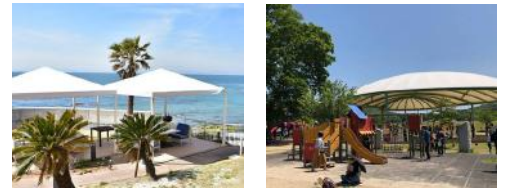
※写真は弊社の施工実績ではありません。