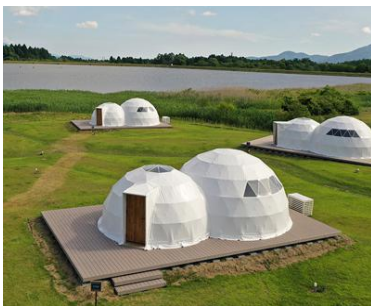
※写真は弊社の施工実績ではありません。

シェルター(英:shelter)とウィキペディアでも『避難所』と出て来る様に、核シェルターや防空壕を連想される方も多いと思います。ですが、交通分野では旅客や貨物を雨風から守る施設、福祉分野ではホームレス緊急一時宿泊施設と言った様に、シェルターという言葉も様々な意味合いを持ってきています。