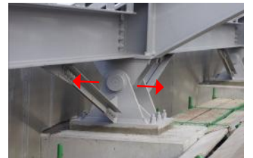
ピン支承は前後方向に力を消す